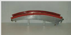
◀ Plasma-Schleppschuh, starr, 280 Ampere wasser- gekühlt

Dieses WS-Formiersystem ist für Behälter mit Mannloch in allen Dimensionen anwendbar. Es setzt voraus, dass die Behälter auf Rollen liegen. Die Schleppschuhe werden mit Hilfe des Kontergewichtes immer in derselben Position zwischen 11 Uhr und 1 Uhr festgehalten, wenn man die Behälter dreht. Die Beine des Stativs sind justierbar, so dass dasselbe Werkzeug für mehrere Dimensionen verwendet wird. Die Montagezeit beträgt etwa 5-10 Minuten. Das Werkzeug kann demon- tiert und durch das Mannloch bis 350 mm \phi herausgenommen werden. Geeignet für WIG-Schweißen. Für das Plasmaschweißen liefern wir auf Ihren Wunsch auch wassergekühlte WS-Schleppschuhe. Dies erfordert allerdings einen runden Behälter ( \pm 30 mm).