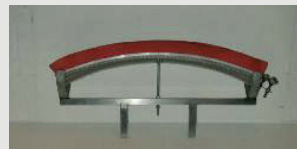
◀ WIG Schleppschuh, justierbar